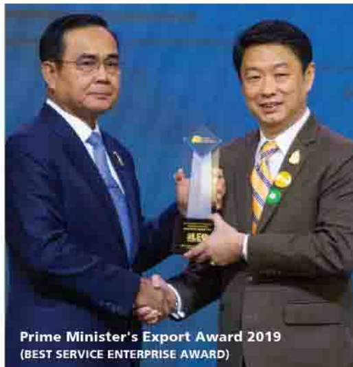
Prime Minister's Export Award 2019 (BEST SERVICE ENTERPRISE AWARD)

The PM Export Award is the highest award given by the Thai government to outstanding companies in the export related of business. It is the symbol of national pride and the far-reaching declaration of the successful dedication of Thai operators in developing themselves and their products and services to be competitive internationally.