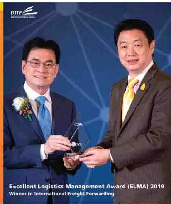
Excellent Logistics Management Award (ELMA) 2019 Winner In International Freight Forwarding